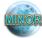
Prix Minor (Mineur) Lune

Apparaît uniquement sur les rouleaux 1 et 2.