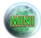
Prix Mini Lune

Apparaît uniquement sur les rouleaux 1 et 2.