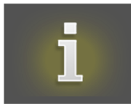
TABLEAU DES GAINS

Vue des règles du jeu et des prix à gagner pour les combinaisons de symboles gagnantes.