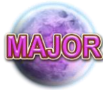
Prix Major (Majeur) Lune

Apparaît uniquement sur les rouleaux 1 et 2.