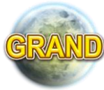
Grand Prix Lune

Apparaît uniquement sur les rouleaux 1 et 2.