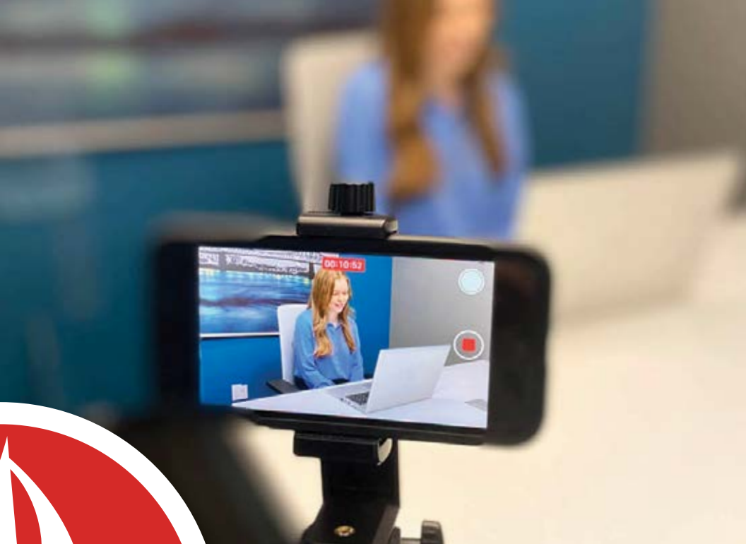
Impact Communautaire 2020-2021